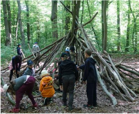
Beim gemeinsamen Bau eines riesigen Tipis waren alle Kinder hochmotiviert.