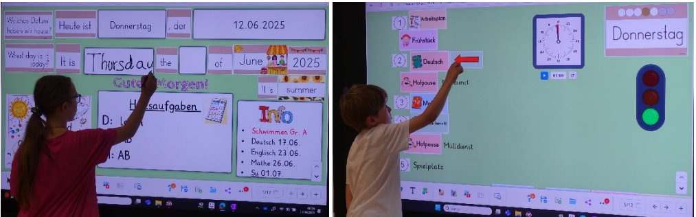
Tagesstart bei den Giraffen (Klasse 3):

Im Dezember wurden am Standort Aifter die ersten digitalen Tafeln geliefert und installiert, so dass sich die Kolleginnen im letzten Schulhalbjahr mit den neuen Möglichkeiten vertraut machen konnten. Alle Kolleginnen waren „Feuer und Flamme“ und haben verschiedene Tools erprobt. Inzwischen haben sich einige Anwendungsmöglichkeiten etabliert, die den Unterricht für die Kinder sehr bereichern. So lassen sich viele Unterrichtsinhalte sehr ansprechend präsentieren oder auch interaktiv an der Tafel erarbeiten. Hier sehen Sie ein paar Beispiele.