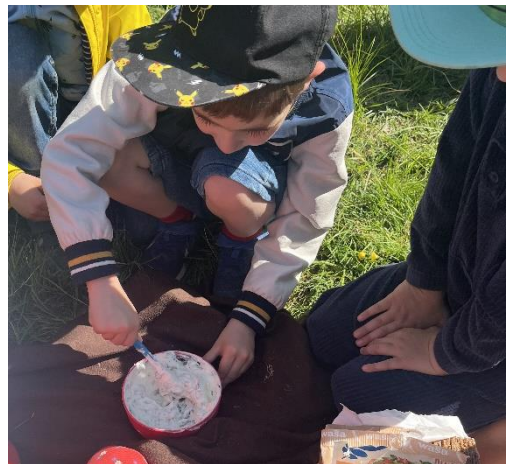
Die Kinder der Seehund- und Eulenkasse sammelten essbare Kräuter im Wald und bereiteten damit einen Kräuterquark zu. Ein eindrucksvolles Erlebnis!