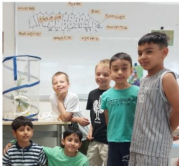
Die Kinder der Froschklasse haben die Raupen genau beobachtet und kennen alle Körperteile.

sich mehrfach häuteten und schließlich verpuppten. Mit Spannung verfolgten die SchülerInnen das Schlüpfen der Schmetterlinge. In der Löwenklasse war es am 26. Mai 2025 so weit. Als wir morgens kamen, war der erste Schmetterling geschlüpft, die anderen folgten in den nächsten Stunden und Tagen. Mit großer Freude, aber auch ein bisschen Wehmut, ließen die Kinder ihre Schmetterlinge schließlich fliegen.