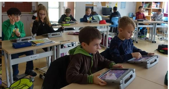
Und nun Konzentration! Wer schafft es unter die ersten 5 schnellsten Kopfrechner*innen?