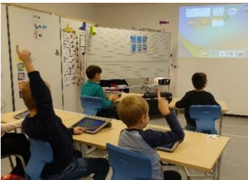
Einführungsstunde zur iPad-Nutzung in der Löwenklasse