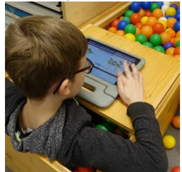
Beim Sitzen im Bällebad. erfreut sich die Arbeit am iPad: großer Beliebtheit.

Kinder schon mit Begeisterung dabei, neue Kompetenzen im Umgang mit dem iPad zu erwerben.