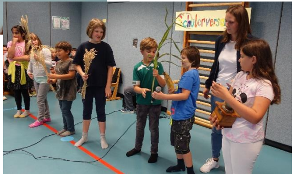
Die Jaguarklasse (Kasse 3) präsentiert verschiedene Getreidepflanzen.

Die Versammlung bildete den Abschluss der Projektwoche zur gesunden Ernährung. Die Klassen hatten Gelegenheit vorzustellen, womit sie sich in der Projektwoche beschäftigt haben und was ihnen besonders gut gefallen hat.