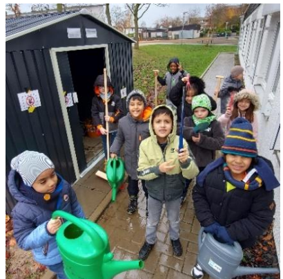
Die Kinder der Froschklasse zeigen stolz ihre Gartengeräte.

Wir alle freuen uns sehr über das neue Gartenhaus und auf die nächste Gartensaison! Ein besonderer Dank an